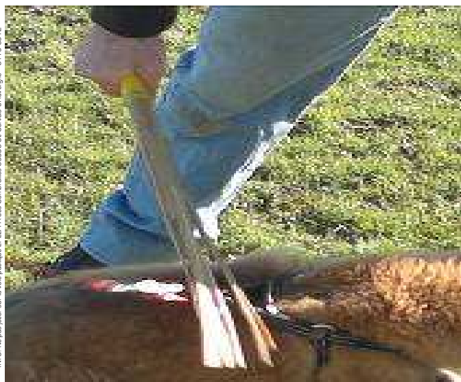
INDS: Ne pas jeter sur la voie publique EPU EPDA des Combrailles 63380 St. Genès d'Auvergne - 04 73 85 72